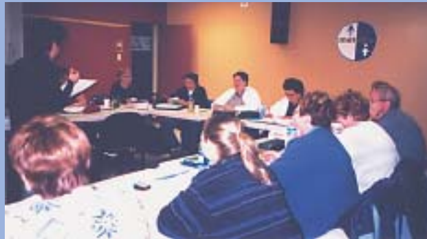
Un cours pour les Métallos chez Sport Maska.

Le Conseil canadien du commerce et de l'emploi dans la sidérurgie (CCCES) a donné des cours correspondant au niveau du secondaire 5 dont des cours de base en informatique, d'infirmière auxiliaire, de préposé aux bénéficiaires, de menuiserie, d'opérateur de machines, etc. Des contacts ont été établis avec les entreprises de la région. Le CCCES a mis un local à la disposition des travailleurs tandis que les Métallos ont fourni les salles destinées aux cours. L'opération a débuté au mois d'août 2004 et se terminera en mars 2005. ●