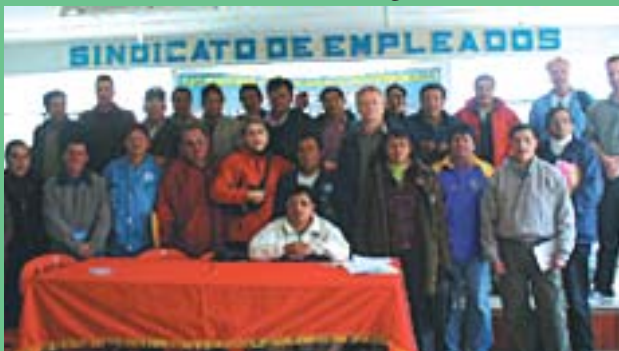
Dirigeants syndicaux qui participent au projet de formation de CEDAL.

Dans la région minière de Pasco, le Fonds humanitaire soutient le Centre d'assistance aux travailleurs (CEDAL) qui offre des cours de formation à des dirigeants syndicaux et l'Association pour les droits économiques et sociaux (ADEC-ATC). L'Institut de santé et travail (ISAT) travaille dans les communautés de Otoa et Huanca avec les travailleurs miniers informels (artisans) et les travailleurs syndiqués de la Compagnie minière Antamina. Le Fonds soutient aussi la Fédération des travailleurs miniers et métallurgistes. ●