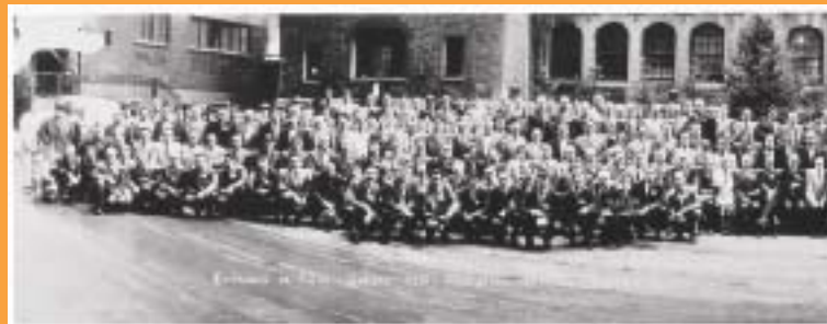
La Fédération des travailleurs et des travailleuses du Québec (FTQ) a organisé une manifestation le 16 février 2007. L'événement sera souligné lors d'un Conseil général qui se tiendra le 16 février 1957 dans cette ville. Les Métallos fêtent également l'anniversaire de la FTQ.

Les Métallos de l'Hôtel Delta à Québec ont obtenu des augmentations de 3 % la première année et de 4 % pour les deux autres années du contrat de travail. Le boss payera 0,25 $ l'heure dans le Fonds de solidarité et 55 % des coûts des assurances. Le salaire horaire moyen est de 16 $. ●