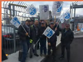
Des grévistes à Tadoussac

Les officiers mécaniciens et de navigation de la Société des traversiers du Québec ont déclenché une grève le mardi 13 octobre. Le service a été entièrement interrompu aux traverses de Sorrel/Saint-Ignace-de-Loyola et Québec/Lévis, tandis qu'un service partiel a été maintenu entre Matane/Godbout/Baie-Comeau, entre Tadoussac/Baie-Sainte-Catherine ainsi qu'entre l'Isle-aux-Coudres/Saint-Joseph-de-la-Rive. Notons que le niveau des services essentiels avait fait l'objet d'une entente avec l'employeur.