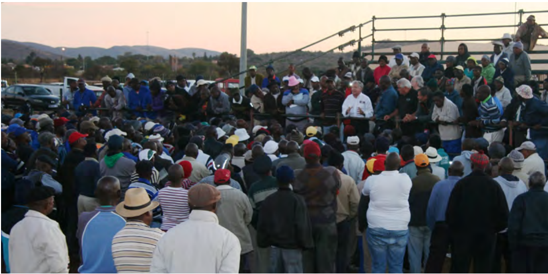
La délégation a rencontré les travailleurs et les retraités d'une usine de Nissan en Afrique du Sud, membres du syndicat NUMSA.