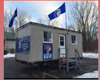
La roulotte était prête pour un conflit cet hiver à la SL 6586 d'ArcelorMittal, mais la grève n'a finalement pas été nécessaire.

La section locale 6586 chez ArcelorMittal à Contrecoeur (Est) s'est dotée récemment d'un fonds d'aide spécial pour soutenir des groupes en conflit ou faire face elle-même à un conflit de travail. Les quelque 550 travailleurs cotiseront à raison de 2 $ par semaine dans ce fonds.