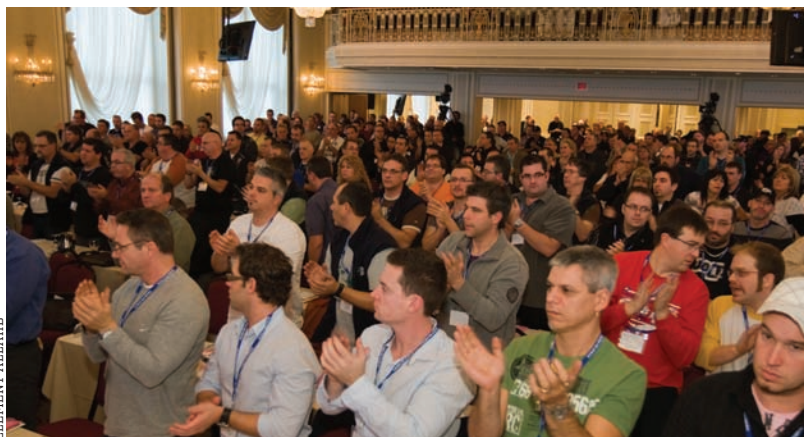
Près de 400 délégués et observateurs ont assisté à l'assemblée annuelle des Métallos du 17 au 19 novembre à Québec.